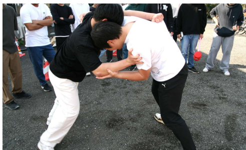
本校vs南校の相撲対決！？