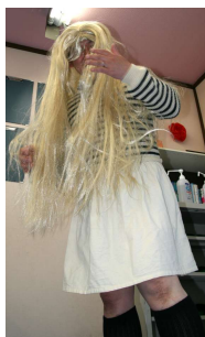
ワタシキレイ？ by石川先生

「公立中から一流をめざす」 小学校四年生の終わり頃、私は今後の進路について考えていた。中学受験をするなら一刻も早く進学塾に入らなければならぬ。しかしまだ幼かった私は、地元の友達と離れて大手の遠い塾まで通うことに意義を見出せなかった。そんな折に目にしたのが、勉クラのチラシに書かれていた冒頭のセリフだ。この言葉を信じ、迷うことなく入塾を決めた。 しかしほどなくして、コロナ禍が到来。通塾もままならなくなったが、勉クラではいち早くオンラインでの受講体制を整え、学びを止めることはなかった。このリモート授業が取り入れられたことにより、部活動で帰宅が遅くなってもゆとりをもって受講することができた。 勉クラのテキストは先生達が手間暇かけて作りあげた唯一無二の教材だ。私はこのテキストを勉クラで使うのはもちろん、学校の宿題である家庭学習としても使用した。 私が浦和高校に合格できたのは、良い環境、良い教材、そして最良の先生方のおかげである。 高校合格がゴールではない。高校では勉強の難易度も上がり、中学よりも更に忙しくなるだろう。たゆまぬ努力を重ねることが、お世話になった方々への恩返しになると私は考えている。