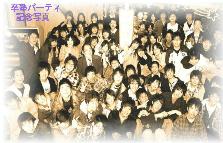
それぞれの未来へ／卒業パーティ、より

全員が第一志望に合格したわけではありません。 でも、みんな、本当によく頑張ってくれました。