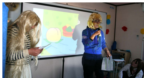
新訳：ギャル語桃太郎 先生方、必死すぎてマジきゃばい

私は中学生になってから勉クラに通い始めました。 三年生になった頃、本格的に「受験」という言葉と向き合うようになりました。始めは志望校すら定まっていりませんでした。が、塾のアドバイスで、考えてもいなかった浦和一女の見学に行きました。とても魅力的で、心の底から「合格したい！」と思える志望校となりました。 塾の授業にいつそう集中して臨み、宿題には丁寧に取り組みました。分からない問題があればLINEや補講で質問することができ、とても助かりました。北辰テストでは合格圏をとることができるよう、成績は急伸びしました。 しかし、それによってしまいに努力圏に転落。そこからは、塾のサポートを受けながら苦手の教科・単元の補強に努めました。 最後まであきらめずに勉強し、合格することができました。勉クラに通って本当に良かったです。